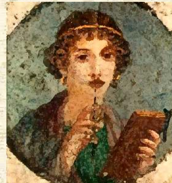
Erato, musa de la poesía lírica.